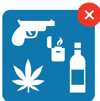
Drank, energiedrank, alcoholvrij drank, drugs, vuur(aanstekers) en wapens