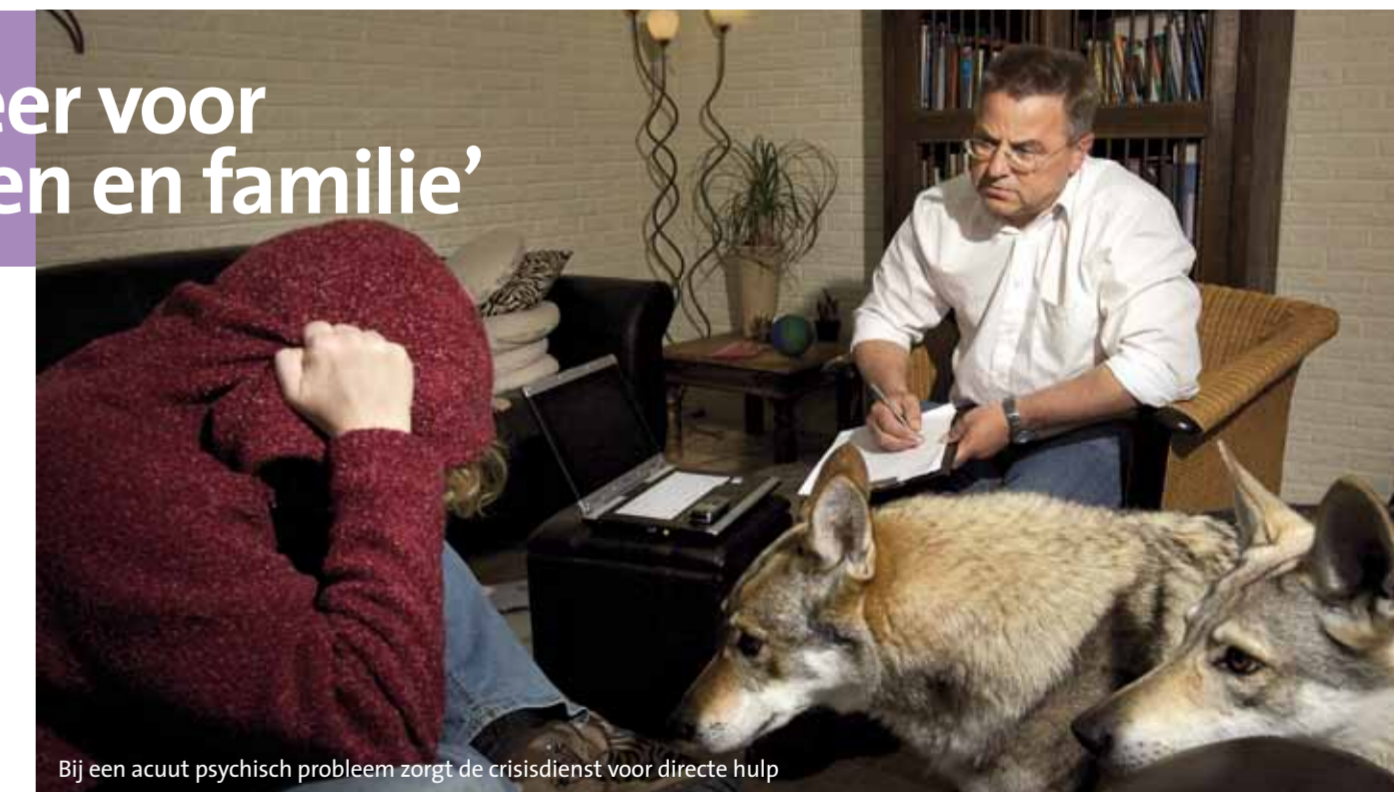
Bij een acuut psychisch probleem zorgt de crisisdienst voor directe hulp